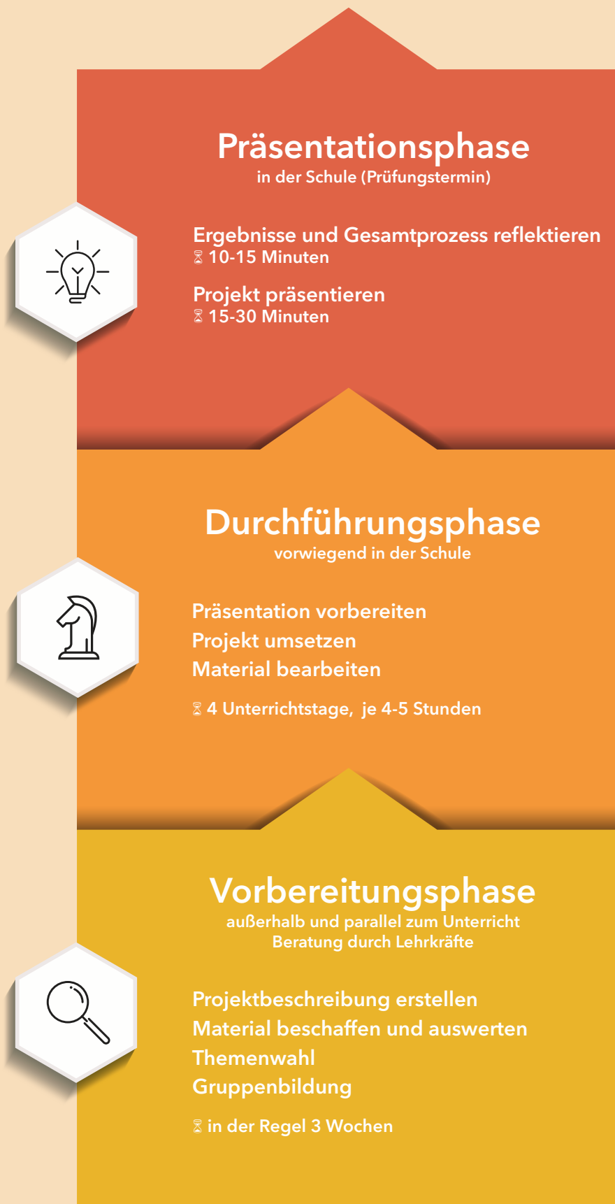
Abbildung 1: Die Phasen der Projektprüfung im Bildungsgang Hauptschule im Überblick